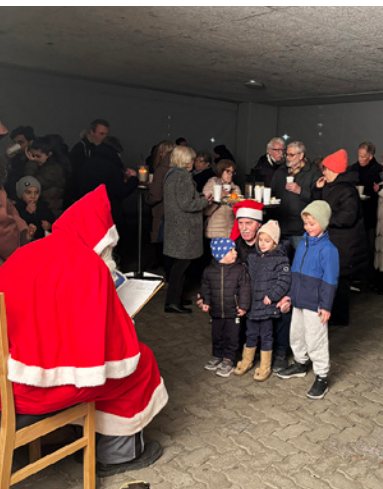
Der Samichlaus besuchte auch die Bewohnenden in der Tüffenwies. In der Silbergrueb und im Morgenrain genossen sie währenddessen das gesellige Beisammensein.

Den Abschluss bildete der Adventsanlass in der Siedlung Schwamendingen – ein Anlass mit besonders vielen Teilnehmenden. Der Sunnige Hof Chor erfüllte den Platz im Mattenhof 1&2 mit weihnachtlichen Klängen und nach einer einjährigen Pause kehrte auch der Samichlaus in die Siedlung zurück. Ein würdiger Abschluss einer Adventszeit, die zeigt: Gemeinschaft verbindet.