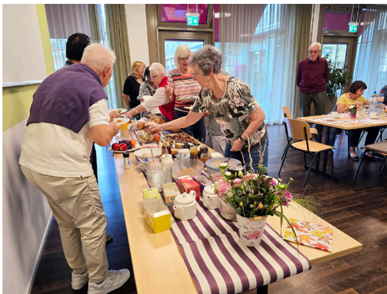
Das gelebte Miteinander fördert bei den Bewohnenden die Lebensfreude.

Der erste Projekt-Anlass fand Ende August 2025 statt: ein gemeinsamer Mittagstisch, der zum Auftakt für