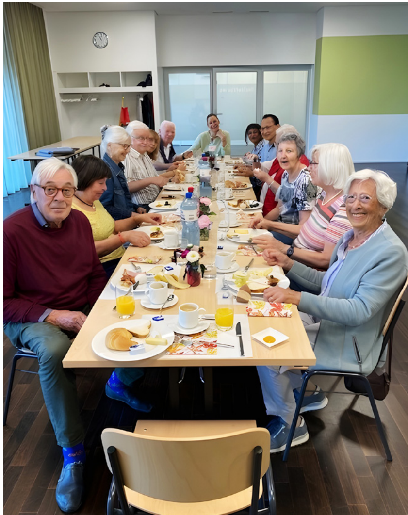
Die Mittagessen in Else Züblin sind bei den Bewohnenden besonders beliebt.

Warum der Fokus auf Ü65? Im Sunnige Hof ist rund ein Viertel der Mieterschaft über 65 Jahre alt. In einzelnen Siedlungen liegt der Anteil deutlich höher. Im Kanton Zürich sind es etwa 17 Prozent. Wir setzen daher dort an, wo der Bedarf und der Nutzen gross sind: Einsamkeit vorbeugen, Gesundheit stärken und selbständiges Wohnen möglichst lange ermöglichen.